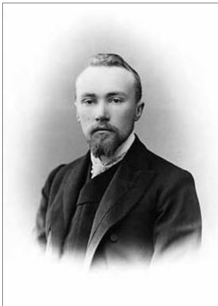
Н. К. Рерих. 1900 г.